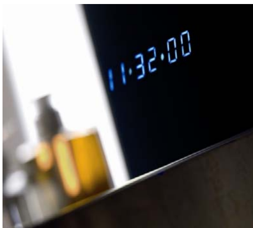
Detalle reloj digital